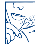
1. APLICAR LA CERA