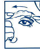
2. RETIRAR LA CERA

Utilice las plantillas para cejas (incluidas) como guía. Seleccione la forma de ceja de la guía que más se asemeje a la línea natural de sus cejas y a la forma de su cara. Mantenga la guía de las cejas sobre sus cejas. Utilice esta guía para determinar la aplicación de la cera.