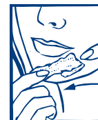
2. RETIRAR LA CERA