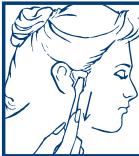
1. APLICAR LA CERA