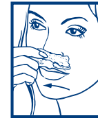
2. RETIRAR LA CERA