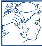
2. RETIRAR LA CERA