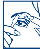
1. APLICAR LA CERA